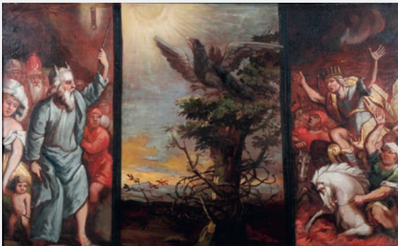
Die Emporenmalerei aus St. Katharinen

Szenenwechsel 2019/1 Durchzug durchs Wasser 5.2.2019-3.6.2019